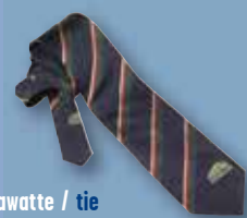
Krawatte / tie