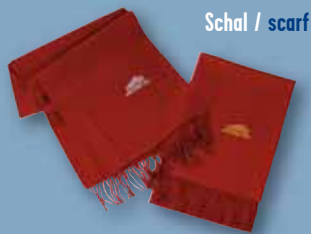
Schal / scarf