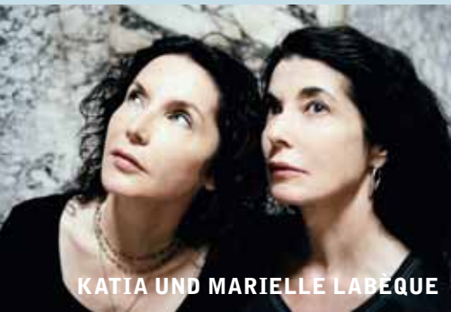
KATIA UND MARIELLE LABÈQUE

Den (Klang-)Teppich auszurollen für Kommandes, die Zukunft einen Spaltbreit hereinklingen zu lassen und neugierig zu machen auf das, was folgt – das ist die Aufgabe eines musikalischen Vorspiels, italienisch „preludio“. Genau so verstehen wir auch die neue Rubrik unserer Zeitschrift, „Preludio“ genannt. Sie deutet an, was Sie im kommenden Monat erwartet, und lädt ein, die folgenden Seiten aufmerksam zu lesen. Denn: Mit Beginn der neuen Saison startet unser Kartenvorverkauf für Mitglieder der Gesellschaft der Musikfreunde bereits zwei Monate vor dem jeweiligen Veranstaltungstermin. Eine Woche später beginnen wir jeweils mit dem allgemeinen Kartenvorverkauf. Was im November gespielt wird, sollten Sie daher schon im September wissen. „Preludio“ gibt den Auftakt dazu.